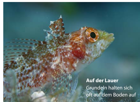
Auf der Lauer Grundeln halten sich oft auf dem Boden auf

werden am Vormittag die anspruchsvollen Tauchplätze angefahren. Am Nachmittag kommen Taucher mit weniger Erfahrung auf ihre Kosten, dann tuckert er zu den Tauchplätzen im östlichen Küstenabschnitt.