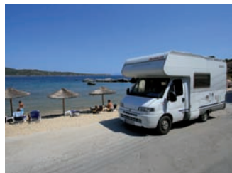
Unterwegs Schöner Ausblick auf die Ägäis (oben). Kein Problem: mit dem Wohnmobil direkt an den Strand