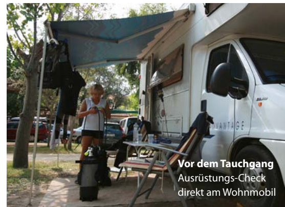
Vor dem Tauchgang Ausrüstungs-Check direkt am Wohnmobil

Viele der Grotten und Höhlen rund um die Halbinsel Sithonia sind noch unerforscht