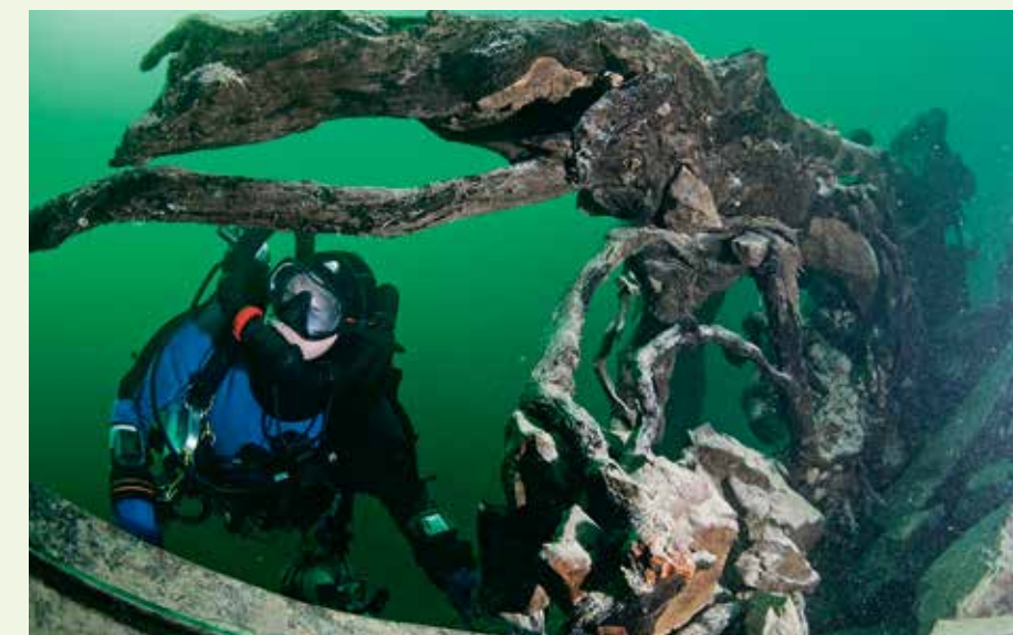
Im Walchensee warten viele abwechslungsreiche Tauchplätze auf Taucher aller Erfahrungsstufen. Im Bild: Wurzelstöcke an einer Felswand. Kaltwasserausrüstung ist ein absolutes Muss!

Umgebung ist wie geschaffen für das Wikingerdorf Flake. Noch heute ist ein Teil der Holzhöhlen in der Ortschaft Walchensee zu besichtigen. Nicht weit vom Drehort liegen zwei beliebte Tauchplätze: »Fleckerlspitz« und »Pioniertafel«. Die Straße, die im Schatten des Jochbergs entlangläuft, ist Privatbesitz. Deshalb ist sie für den öffentlichen Verkehr gesperrt. Zu erreichen sind die Taucheinstiege nur zu Fuß. Die Ausrüstung finden dann in einem Ziehwagen Platz. Wir bevorzugen eine etwas einfachere Variante und chartern am Feld ein Tretboot. An der Pioniertafel herrschen im Herbst optimale Verhältnisse. Wegen des im Jahre 1924 fertiggestellten Wasserkraftwerks sind am Walchensee bis zu fünf Meter Pegelschwankungen möglich. Geplant und durchgeführt