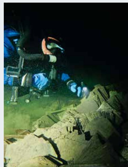
Das Schindelwrack bei Berg muß schnell gesunken sein. Die Fracht liegt geordnet in der Fahre.

feld übergeht, ist in 38 Metern der alte Ford aus den fünfziger Jahren schemenhaft zu erkennen. Mit Pressluft ist dort nur ein kurzer Aufenthalt möglich.