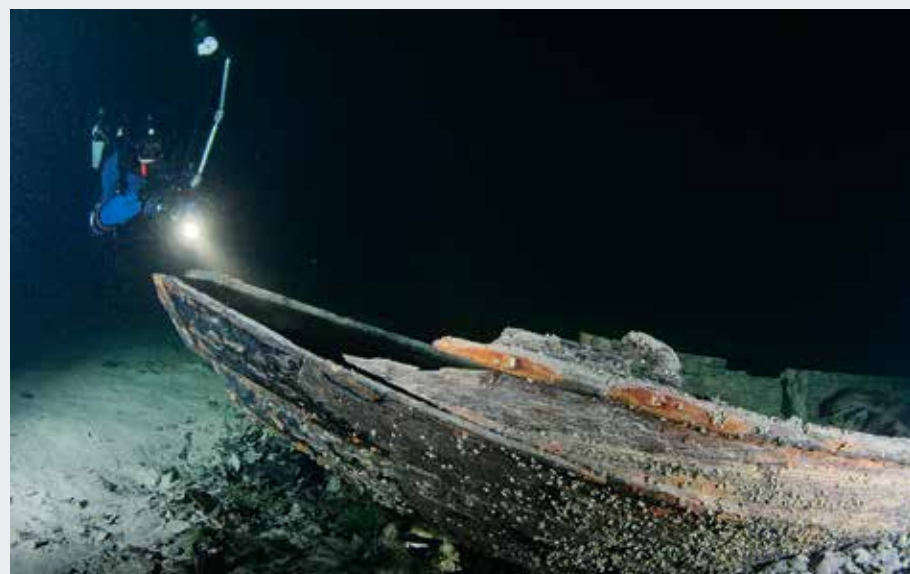
Am Bug des Holzkahns befand sich eine geschnitzte Schneckenverzierung. Diese wurde abgenommen. Heute kann die Schnitzerei im Seefahrtsmuseum in Starnberg besichtigt werden.

bahn kam das Baumaterial nach Tutzing, von dort übernahmen die kleinen Lastkähne, die sogenannten Fahren, die Verteilung am See. Bei günstigem Wind wurde zur Unterstützung ein Segel aufgezo-gen. Doch manch eine Fahre ist ein Spielball der tückischen Föhnstürme geworden und versank samt Ladung. Heute werden sie von Tauchern meist durch Zufall entdeckt. So auch das Schindelwrack bei Berg. Vollbeladen mit Schieferdachziegeln liegt der Holzkahn im schlammigen Boden. Sehr schnell ist er gesunken, denn die Schindeln sind noch im Wrack ordentlich aufgereiht. »Hände weg!«, mahnt uns Jürgen. »Obwohl gut konserviert, sind die Planken schon sehr morsch, und eine Unachtsamkeit würde dieses einzigartige Wrack zerstören.«