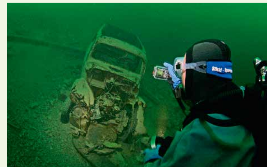
Das Autowrack am Tauchplatz Galerie ist ein beliebtes Fotomotiv. Der Einstieg ist bei Niedrigwasser schwierig, dann muss man mehrere Meter über schroffe Felsen klettern, um ans Ufer zu kommen.