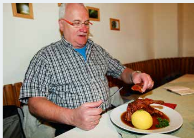
Bayerische Oberflächenpause: Nach einem spannenden Tauchgang schmeckt die halbe Ente umso besser. Nicht im Bild: das Dekobier.

➤ Weitere Infos: Touristenbüro Walchensee 82432 Walchensee Telefon +49 (0) 8858 411 info@walchensee.de www.walchensee.de