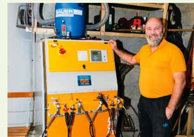
Brandaktuell: Die neue Füllstation am Walchensee im Panoramahotel und Restaurant Karwendelblick. Ein idealer Ausgangspunkt für Seeabenteuer.