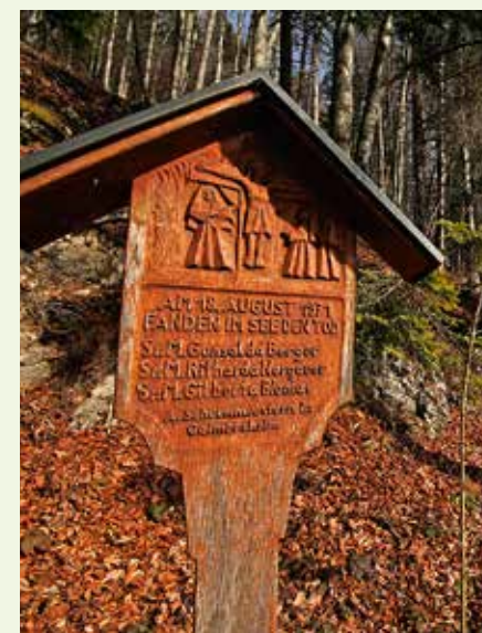
Am Tauchplatz Pioniertafel erinnert eine Holztafel an drei verunglückte Schulschwester.

Wir sind nicht die Ersten und müssen uns die begrenzten Parkmöglichkeiten mit Surfern teilen, die auf Wind lauern. Uns kümmert die Flaute nicht. Wir gleiten bei ruhiger Wasseroberfläche unserem Ziel, einem alten Autowrack, entgegen. Zuerst begleitet uns rechter Hand die schroffe, teils überhängende Wand. Die Felsvorsprünge und Nischen sind mit weißem Sediment bedeckt, wie eine schneebedeckte Märchenlandschaft beeindruckt das markante Gestein. Als die Unterwasserlandschaft in ein Schotter-