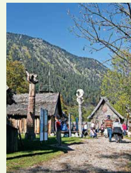
Die Dorfkulisse von Flake aus dem Kinofilm »Wickie und die starken Männer«.