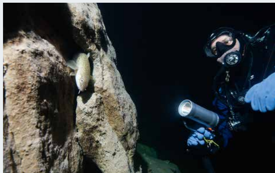
Die stark zerklüftete Felswand in Allmannshausen – der bekannteste Tauchplatz des Starnberger Sees. Die unzähligen Nischen und Löcher sind ein optimaler Lebensraum für Aalruten.

Ein kurzer Blick nach oben lässt die Sichtweite erahnen. Das Wellenspiel an der Wasseroberfläche ist noch aus großer Tiefe gut zu erkennen. Strahlendes Sonnenlicht hüllt die zerklüfteten Felsen in mystische Dämmerung. »Im Frühjahr haben wir hier gut und gerne 20, wenn es gut ist auch 30 Meter Sichtweite!«, versprach uns Jürgen vor dem Tauchgang. Begeistert können wir die nun tatsächlich genießen. ➤