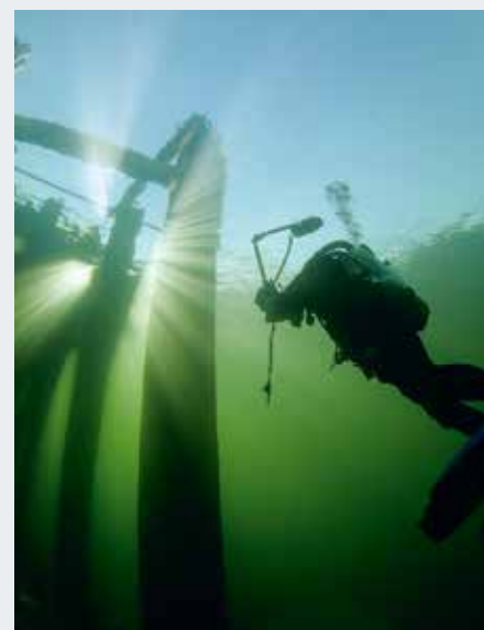
Nur wenn in den Wintermonaten die Schifffahrt ruht, kann an den Anlegern getaucht werden.